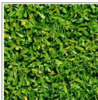
Figure 4: Tinea Pedis Poaceae threatens discomfort to bare feet.