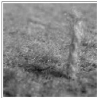
Figure 1: Even the carpet-like Carpeterium Pratensis requires mowing.

Zad 2. Przygotuj galerię o poniższym układzie (obrazki dowolne).