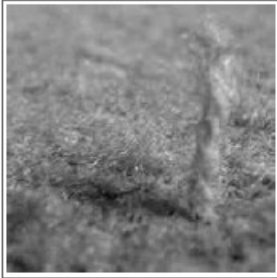
Figure 1: Even the carpet-like Carpetorium Pratensis requires mowing.

A selection of indoor sod options: reviewed and tested by CosmoFarmer.com in our state-of-the-art “Apartment Laboratory” on 5th Avenue.