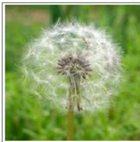
Figure 6: The dandelion: scourge of the apartment farmer.