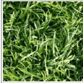
Figure 2: Creeping Bentgrass is best suited for outdoor use and should be avoided by the indoor farmer.