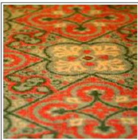
Figure 5: The difficult to maintain pattern of this indoor lawn is a sight to behold.