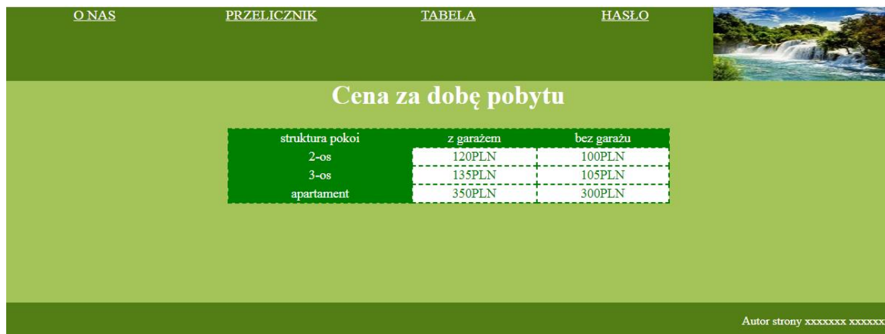
Rys 6: Strona tabela.html

W nagłówku stopnia pierwszego tekst „Cena za dobę pobytu”