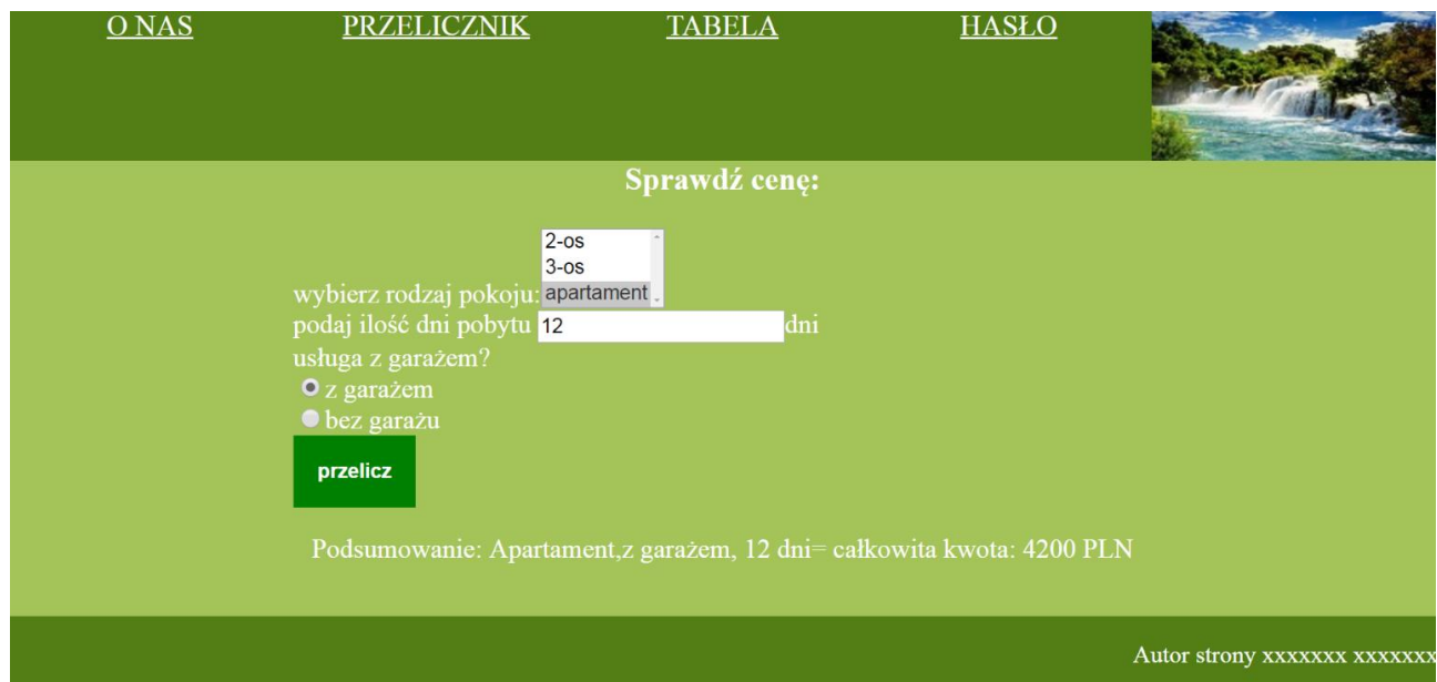
Rys 4: Strona przelicznik.html po wpisaniu ilości dni pobytu