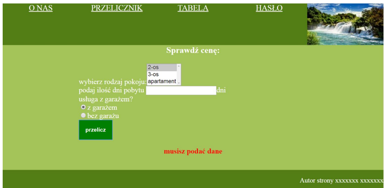
Rys 5: Strona przelicznik.html po kliknięciu "przelicz" bez podania wartości w polu input