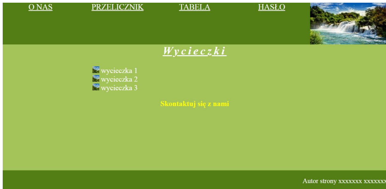
Rys 1: strona index.html