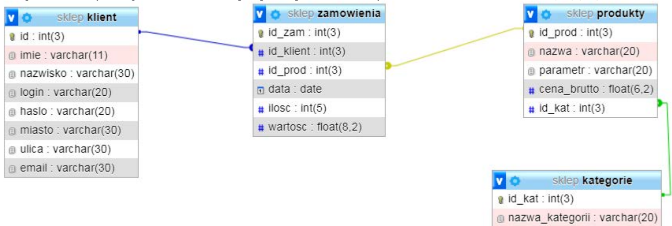
Obraz 1. Tabele bazy danych

Do wykonania operacji na bazie należy wykorzystać tabele przedstawione na Obrazie 1.