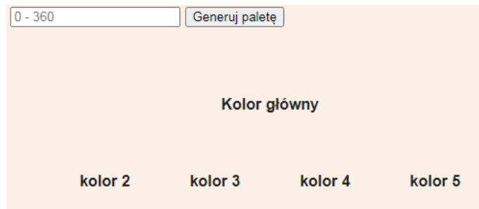
Obraz 4. Fragment bloku głównego - stan początkowy aplikacji